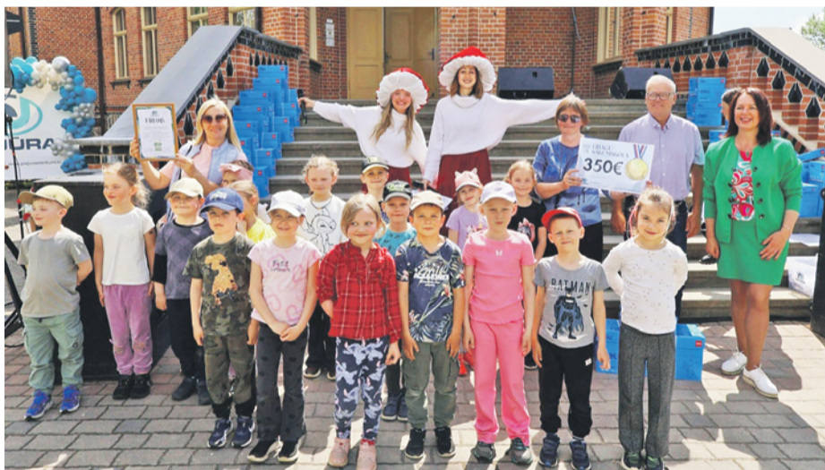
Lībagu sākumskolas audzēkņi savāca pavisam 0,1 tonnu izlietoto bateriju, iegūstot 10. vietu starp visiem dalībniekiem.

Noslēguma pasākumā piedalījās vairāk nekā 450 dalībnieku no Tukuma un Talsu novada izglītības iestādēm. Tāpat kā iepriekšējos gados, katra savāktā makulatūras tonna dalībniekiem tika atalgota ar vienu biroja papīra paku. Savukārt konkursa aktīvākie dalībnieki – tie, kuri savāca visvairāk makulatūras un bateriju, saņēma apmaksātus transporta izdevumus izglītojošas ekskursijas organizēšanai. Par balvām bateriju vākšanas konkursa uzvarētājiem rūpējās uzņēmums „AJ Power”.