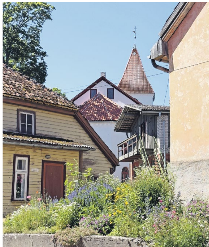
Vēsturiskajā pilsētvidē jumta seguma maiņa ne tikai jāaskaņo ar Talsu novada būvvaldi, bet arī ar Nacionālo kultūras mantojuma pārvaldi.