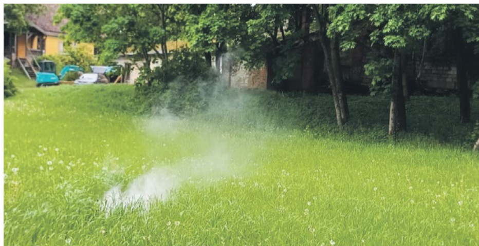
SIA „Talsu ūdens” veic kanalizāciju sistēmu pārbaudes, izmantojot mākslīgos dūmus. Publicitātes foto

kanalizācijas sistēmā rada ievēroja-mus zaudējumus, kas atspoguļojas uz kopējo kanalizācijas savākšanas un at-tīrīšanas tarifu, jo pieaug elektroenerģijas patēriņš, samazinās infrastruktū-ras kalpošanas laiks, pieaug maksājamo nodokļu apmērs.