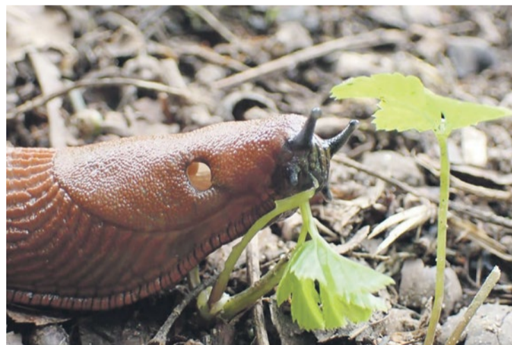
Spānijas kailgliemezis ( Arion vulgaris ).

Atgādinām, ka par invazīvās sugas ierobežošanu privātajās teritorijās ir atbildīgi īpašnieki – pašvaldība šādas darbības privātpašumos nedrīkst veikt.