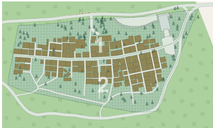
Mērsraga Jauno kapu digitālā karte

Kapsētu digitalizācijas nepieciešamību uzsvērusi arī Valsts kontrole, veicot kapsētu apsaimniekošanas un uzturēšanas revīziju. Kapu grāmatas var pazust vai laika gaitā var tikt sabojātas, līdz ar to var zaudēt arī visa informācija par apbedījumiem.