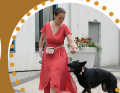
DEJAS AR SUNI